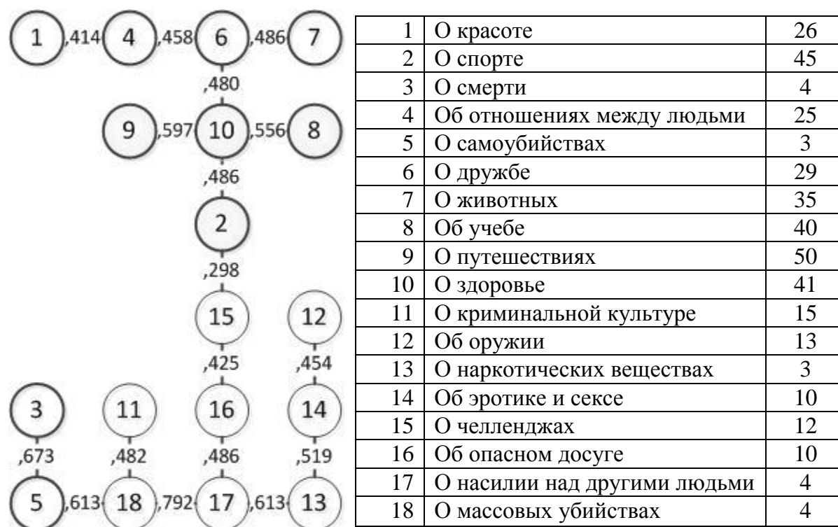
Рис. 3. Корреляционный граф упоминания школьниками наиболее интересных социальных групп в интернете (справа указаны доли выбора варианта ответа «Очень интересно»; %)

факторов). Поэтому факторный анализ позволяет группировать не только переменные, но и объекты – в данном случае респондентов.