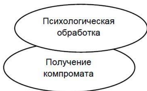
Рис. 7. Структура четвертого этапа вовлечения подростка

На четвертом этапе работы модераторы осуществляют жесткое удержание пользователей на паблике или форуме, не позволяя покинуть сообщество даже тем подросткам, которые уже разочаровались в движении, его идеях, потеряли к нему интерес. Для этого модераторы стараются вызвать у пользователей сильные эмоции, а также своего рода психологическую зависимость, предоставляя подросткам данные с шок-контентом, рассказы эротической тематики, в которых подробно описываются сексуальные отношения с детьми, животными и умершими людьми, то есть, подробно описаны акты педофилии, зоофилии и некрофилии. Подростки на страни-