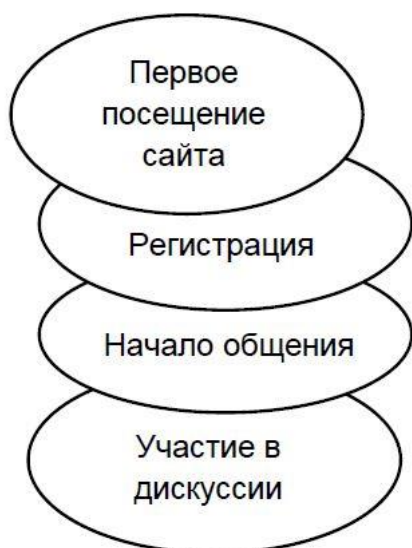
Рис. 5. Структура первого этапа вовлечения подростка

При первом посещении пользователем сайта, паблика или форума и попытке зарегистрироваться модераторы проверяют данные профиля пользователя с целью убедиться в том, что это действительно подросток или молодой человек, а не взрослый, например, сотрудник специальных служб, учитель, преподаватель, родитель. Изучаются фотографии одноклассников или одноклассников, иные связи пользователя в социальной сети, круг его интересов, подписки. Только после этого модераторами да-