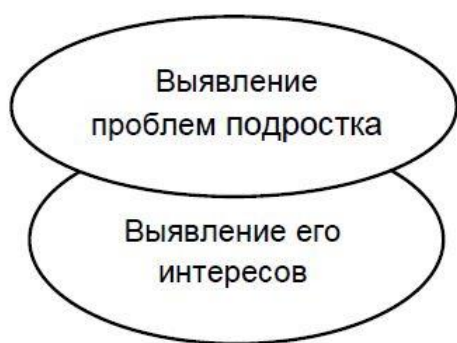
Рис. 6. Структура второго этапа вовлечения подростка

Модераторы выявляют наличие у подростков социальных и психологических проблем. В первую очередь, это относится к взаимоотношениям с родителями и другими близкими родственниками. Именно утрата доверительных отношений с родителями отключает у подростка механизмы самоконтроля и запускает развитие склонности к гедонизму, постоянному поиску удовольствий, делая его легкой добычей для модераторов соответствующих деструктивных движений.