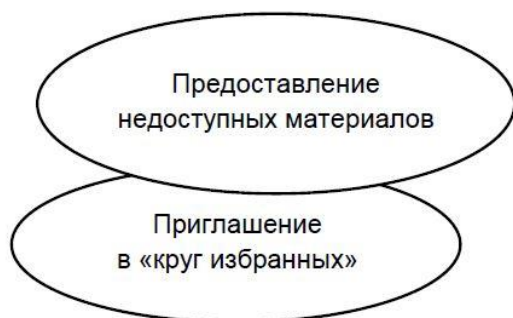
Рис. 7. Структура третьего этапа вовлечения подростка

На третьем этапе работы (формирование агента) модераторам важно поддержать интерес пользователей к контенту паблика или форума, сделать так, чтобы подростки сохраняли устойчивый интерес к обсуждаемым