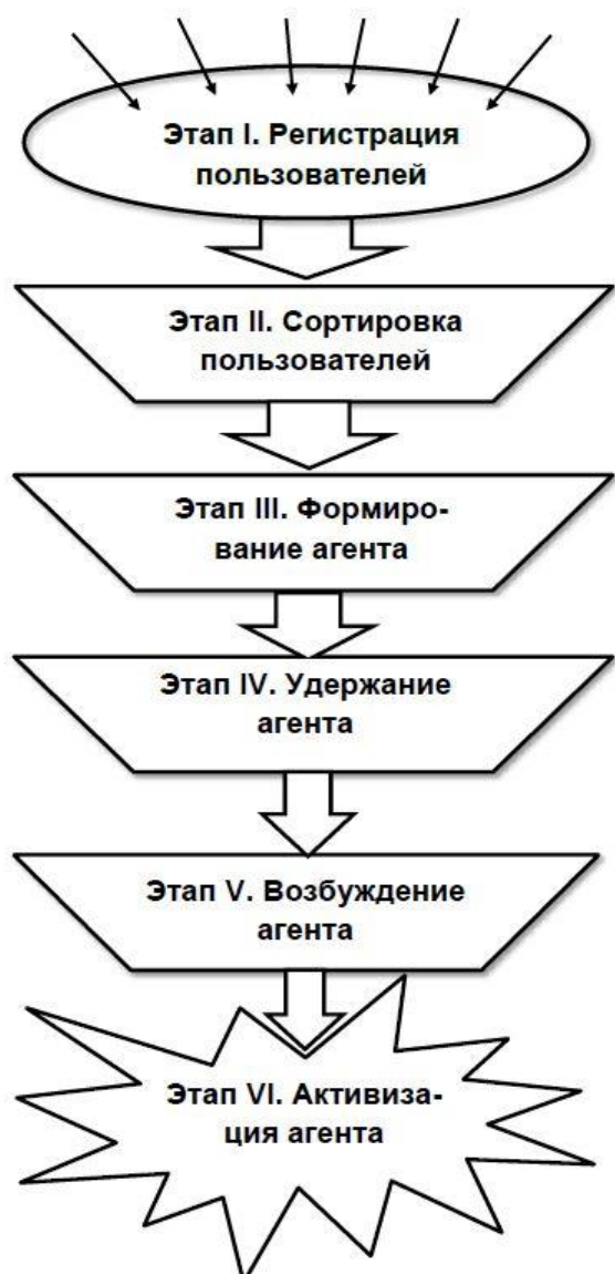
Рис. 4. Этапы вовлечения подростков в деструктивные сетевые сообщества

этого пользователь оказывается в зоне внимания модератора данного сообщества.