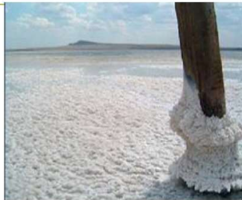
из соленых озер