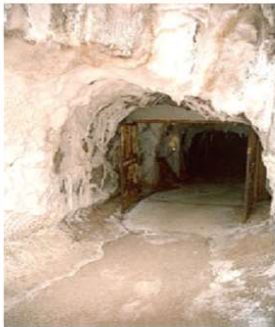
из соляных шахт