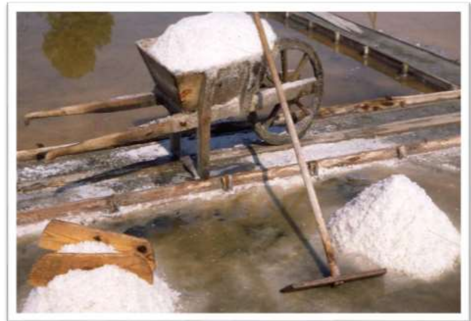
Как раньше добывали соль