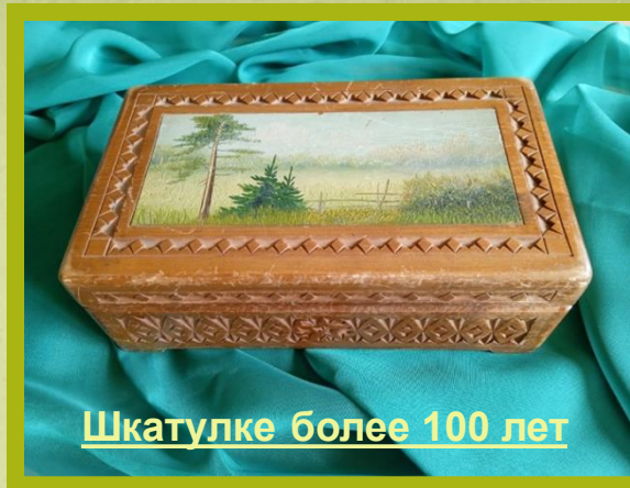
Шкатулке более 100 лет